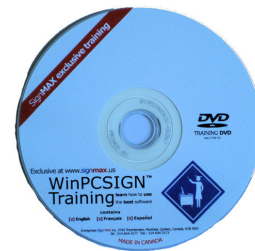
DVD de formation