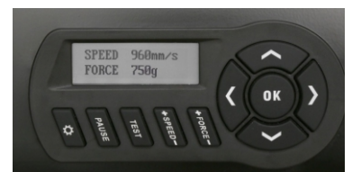
Panneau de contrôle LCD

Le logiciel DrawCut Pro permet d'importer facilement vos fichiers vectoriels Illustrator, CorelDraw et découper vos impressions. Le logiciel inclus un outil de vectorisation automatique en deux clics. Même avec un fichier de basse qualité Jpeg, Gif, il est en mesure de lisser et rendre les contours de hautes qualités.