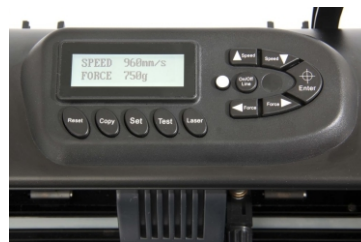
Panneau de contrôle LCD