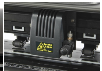
Oeil optique laser Lapos